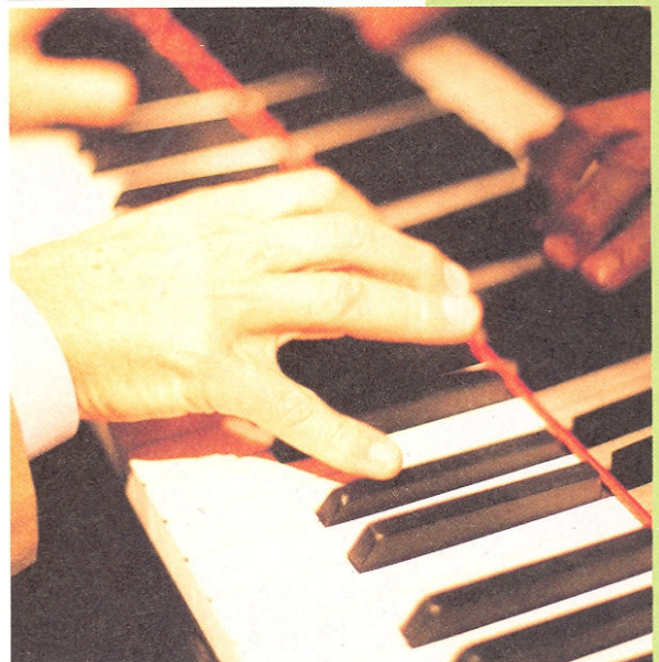
パオロさんが弾いているのは、ハービー・ハンコックも実際に演奏した《F308》。ベルマンやチャコリニなど、クラシックの巨匠たちに愛された名器だ。