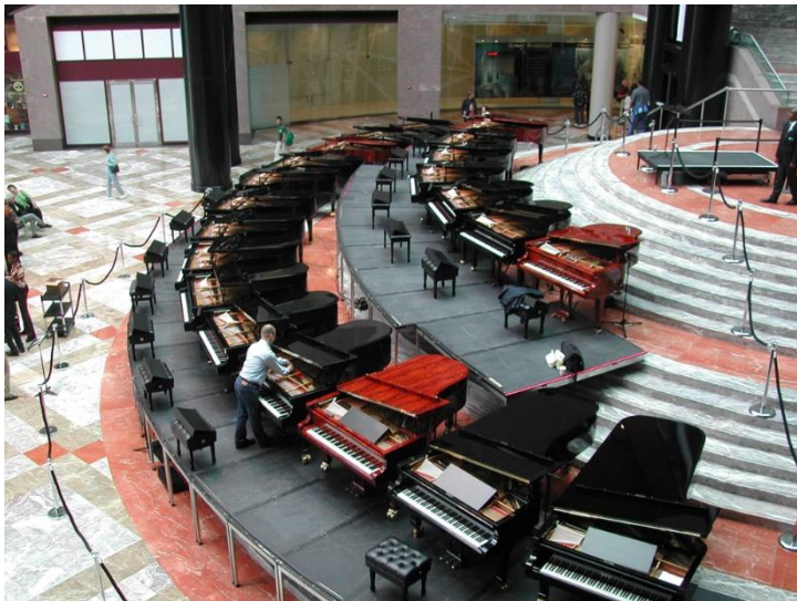
Sopra: Angela Hewitt

In occasione delle celebrazioni in ricordo delle vittime del crollo delle Torri Gemelle a New York, nel settembre 2003 vengono utilizzati 21 pianoforti Fazioli per l'esecuzione della prima assoluta di 'Sinfonia per 21 pianoforti', del compositore e pianista Daniele Lombardi.